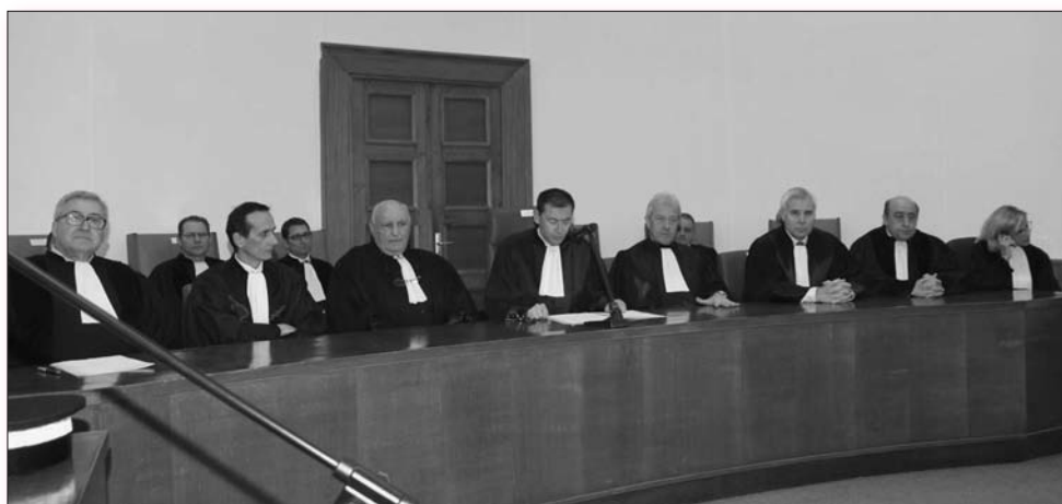
Rentrée solennelle du 14 janvier 2012 au Palais de Justice de Bastia