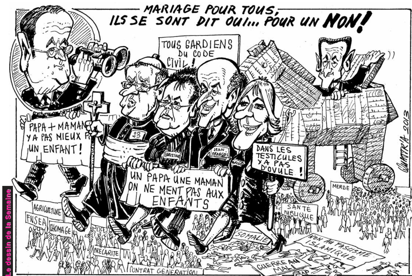
Le dessin de la Semaine

Puisse l'histoire d'aujourd'hui ne pas ouvrir un nouveau chapitre de malentendus, et s'en tenir strictement à l'objectif affiché : « éradiquer l'extrémisme et son corollaire, le terrorisme ! »